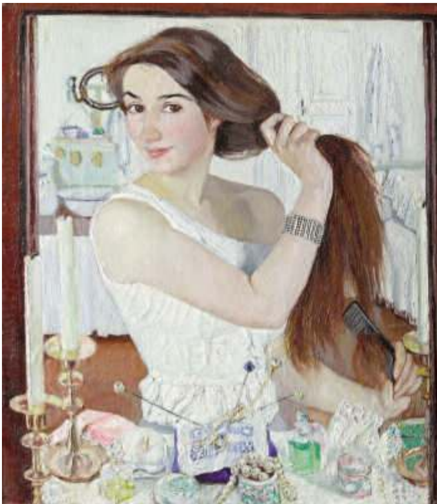
Зинаида Серебрякова. За туалетом. Автопортрет. 1909 год