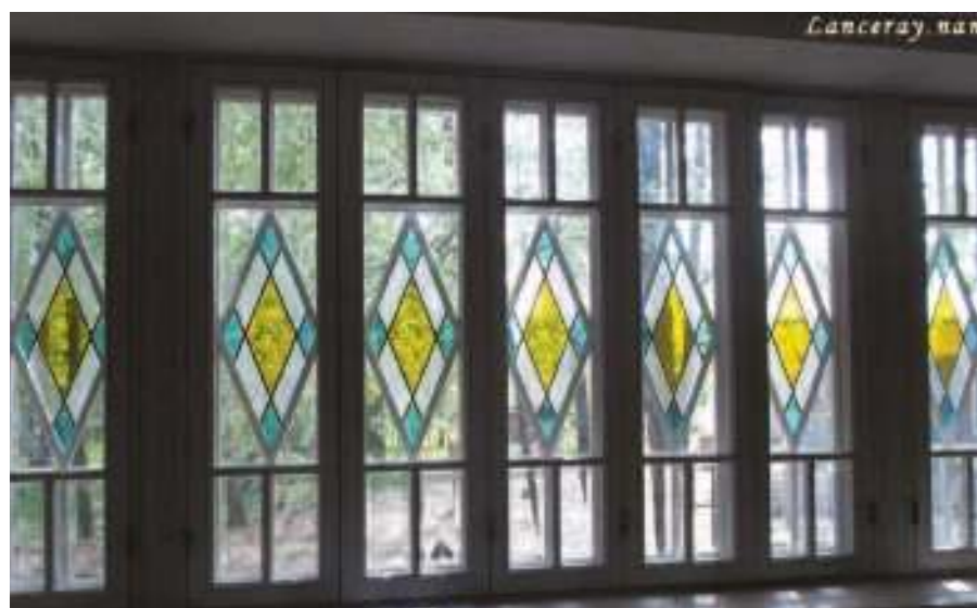
Цветные витражи Евгения Лансере Четвертого