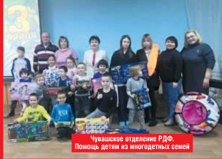
Чувашское отделение РФФ. Помощь детям из многодетных семей