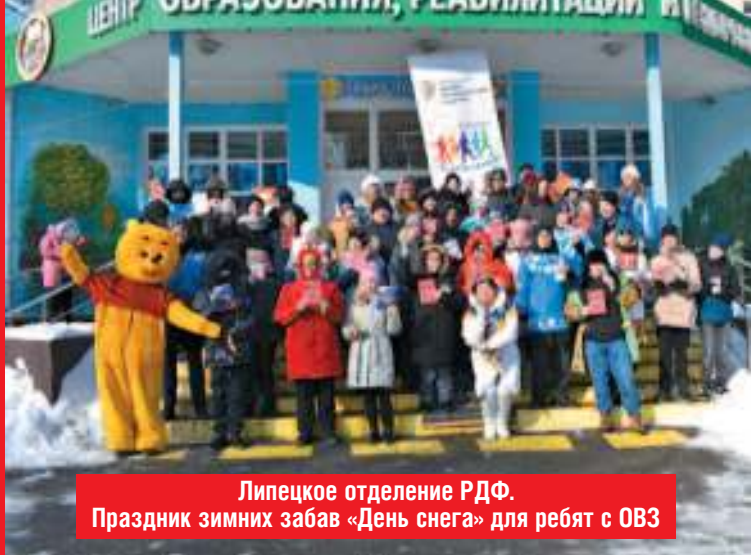
Липецкое отделение РФФ. Праздник зимних забав «День снега» для ребят с ОВЗ