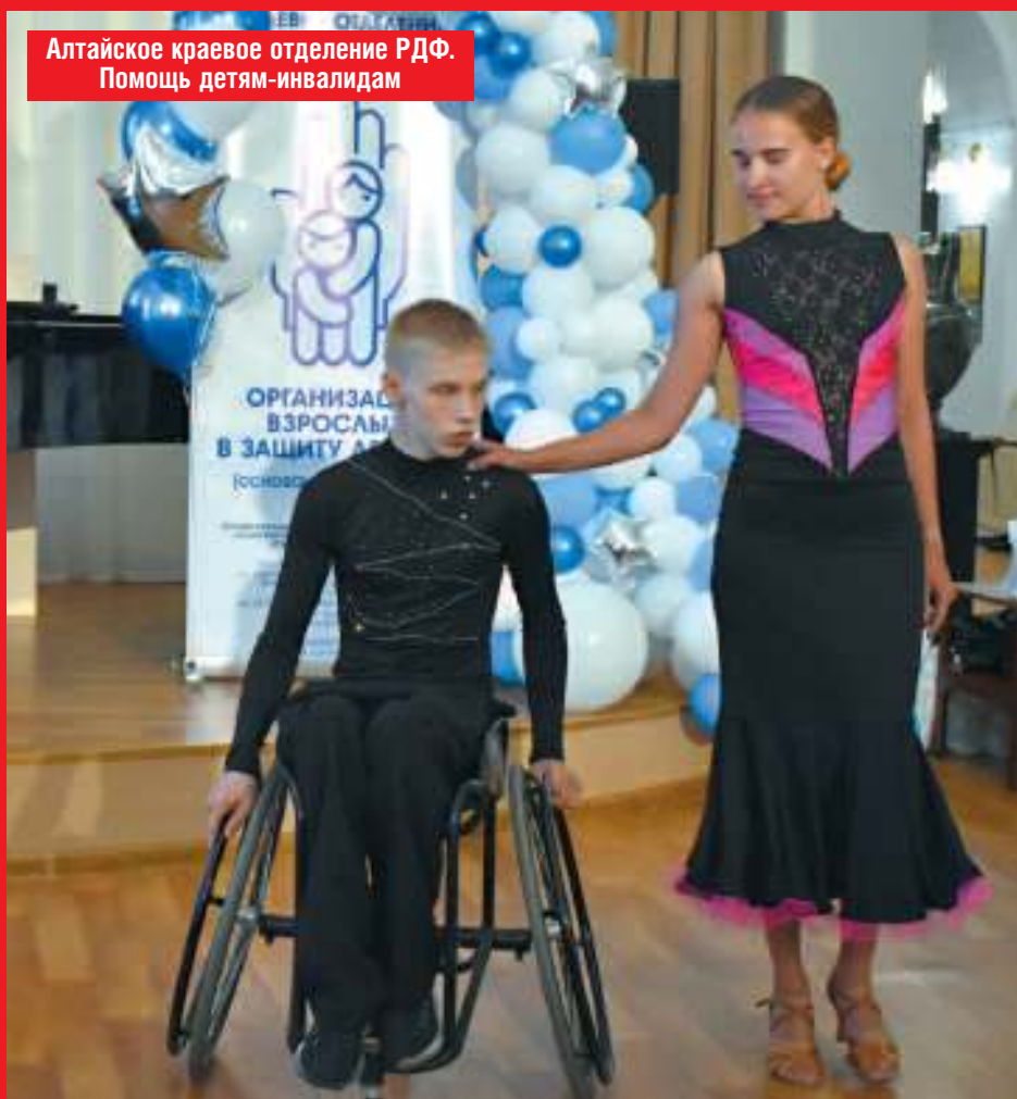
Алтайское краевое отделение РФФ. Помощь детям-инвалидам

Только несколько мгновений из многих тысяч свидетельств, где и как работает Детский фонд