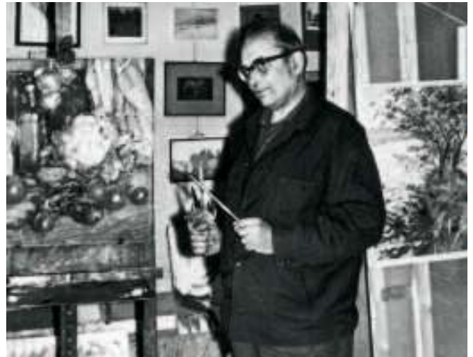
Евгений Евгеньевич Лансере (1907–1988)