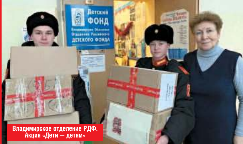
Владимирское отделение РФФ. Акция «Дети – детям»