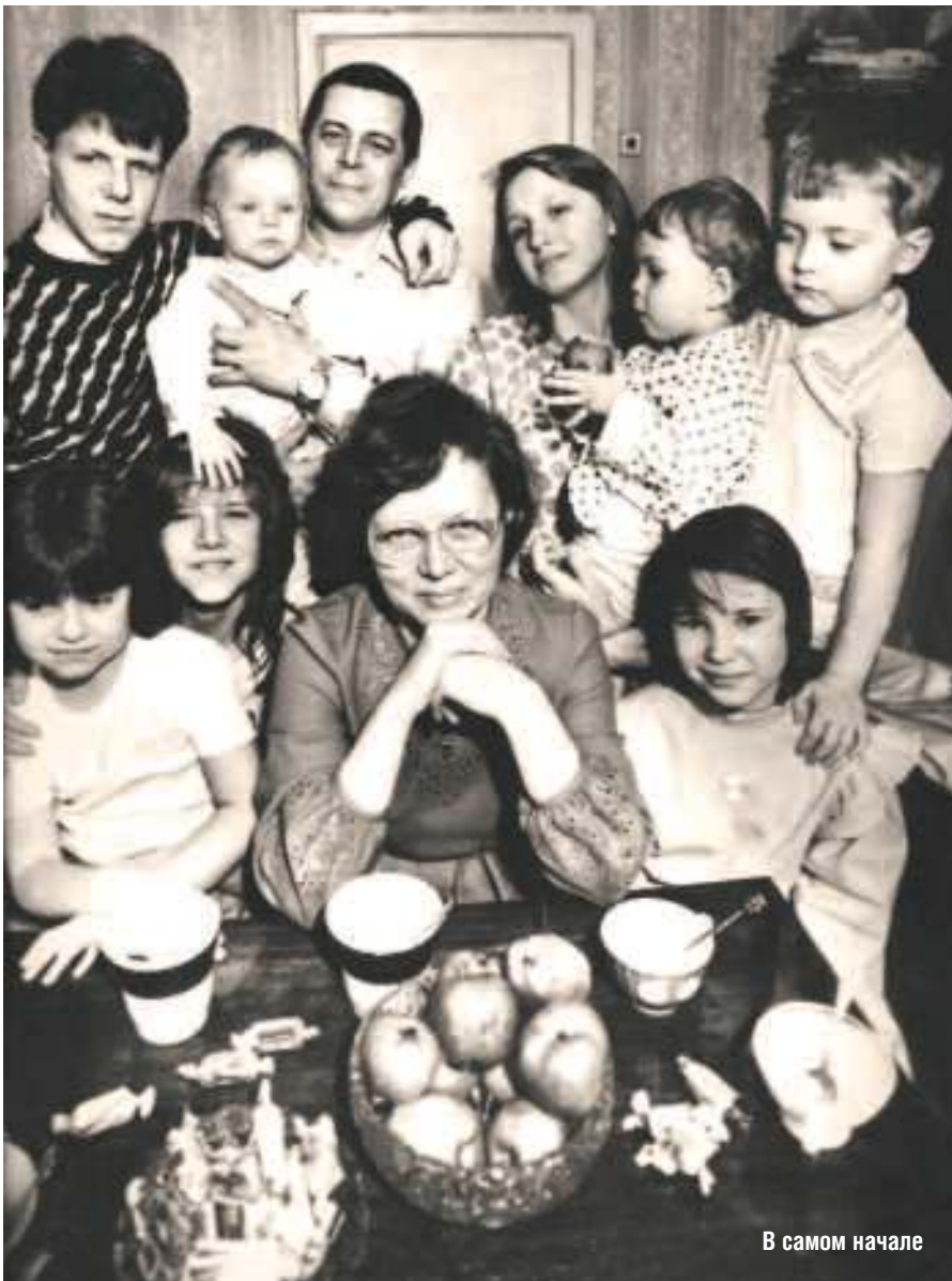
В самом начале

Участковый взял с детской кровати засаленное одеяльце и хотел