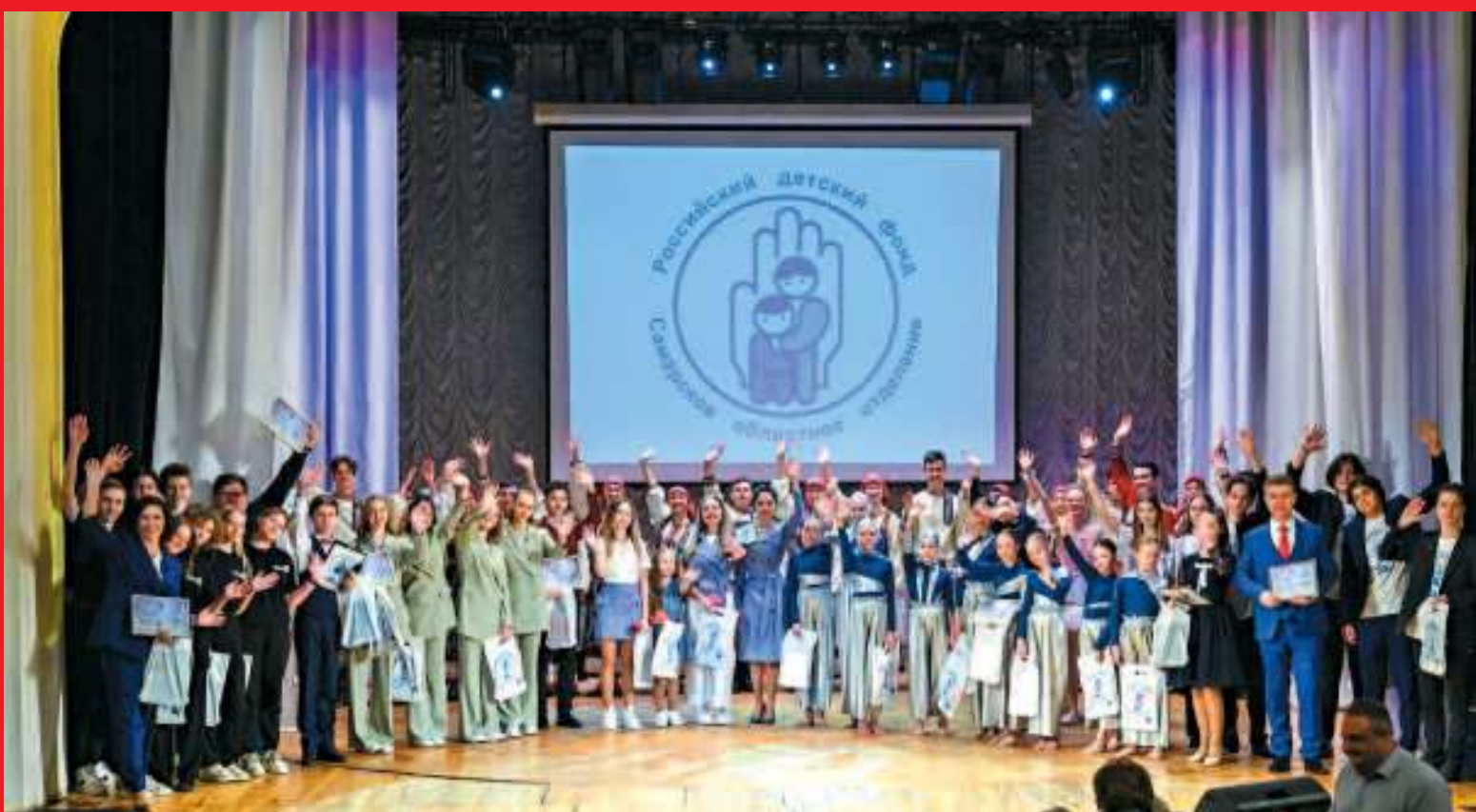
Самарское отделение РФФ. Празднование 35-летия отделения