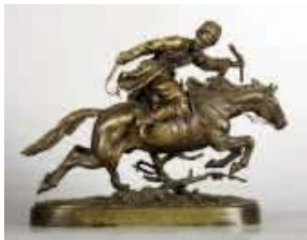
Евгений Александрович Лансере. Погоня. 1871 г. Бронза. Чеканка

— Их не так уж много и все они нам очень дороги. Например, скульптурный портрет его дочери Софии, в честь которой я назвал свою дочку Соней. Или вот этот жеребёнок. Смотрите, как он нетерпеливо бьёт копытом — того и гляди рванет вскачь. Евгений Александрович воплотил в бронзе арабских скакунов,