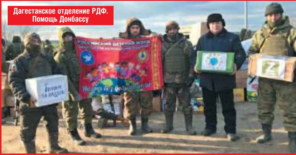
Дагестанское отделение РФФ. Помощь Донбассу