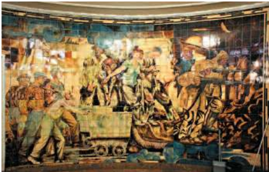
Майоликовое панно «Проходка шахты. 1935 год» (станция метро «Комсомольская», Москва). Художник Евгений Евгеньевич Лансере (1875–1946)

по-французски при нас, детях. нас обучали этому языку с самого детства. И мы детей так стараемся воспитывать.