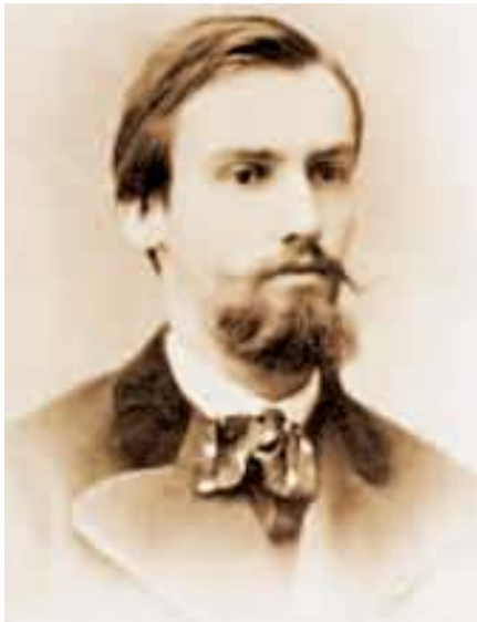
Евгений Александрович Лансере (1848–1886)

Редкая неделя проходит без того, чтобы кто-то у нас дома не работал — приходят студенты, искусствоведы. Одно из правил нашей семьи, которое мне прививали и папа и мама, — делиться информацией, духовным опытом... Впрочем, возможно, архив пригодится и с точки зрения материальной.