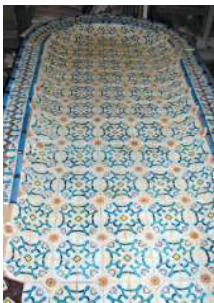
Керамика Евгения Лансере Четвертого